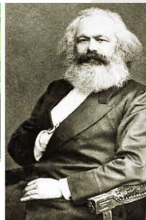
KOMMUNISTISCHER KRIMI In AAA – Das Manifest der Macht geht es um einen Anwalt, der ein direkter Nachfahre von Karl Marx sein soll.